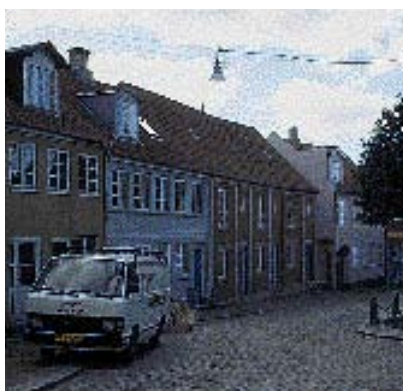
En ny bygning godt tilpasset den eksisterende husrække.

En bygnings udformning har betydning for hvor høj den opfat-