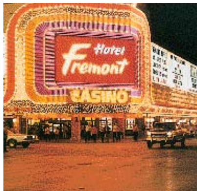
Las Vegas-facaden er trods alt en tak for vildt - også for Østervold.

de omkringboende eller trafikanter. Kravene til lysskilte er forskellige for midtbyens “kvarterer”, men