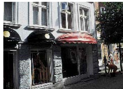
Plasticmarkisen reflekterer lyset, så teksten ikke kan læses.