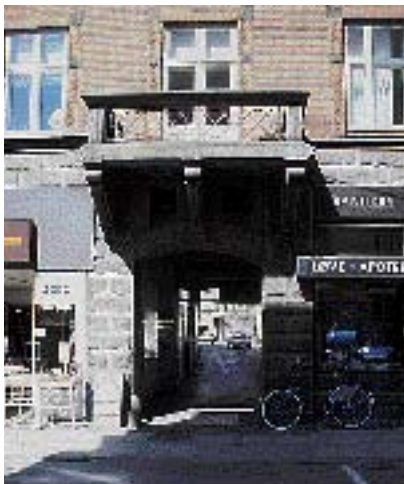
En smutvej gennem karreen.

i mange gader dækket med røde tegl eller skifer. I disse gader er det bedst, at holde fast i traditionen og bruge de oprindelige tagdækningsmaterialer.