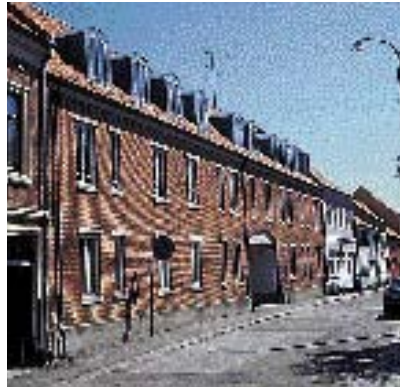
Den nye bygning er for lang og dominerer gadebilledet.

have øje for gadens "rytme". Med rytme menes længden af den enkelte facade i forhold til hele gedefacaden. Det betyder ikke at alle facader i en gade skal være lige lange. Der er dog grænser for hvor lang en