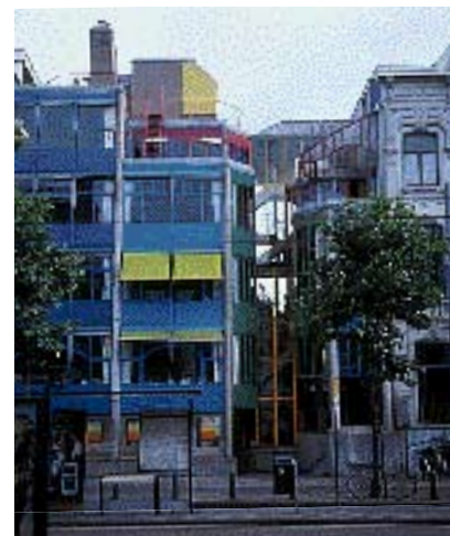
Glas og farver brugt på en god måde til boliger i Amsterdam.

Det er vigtigt at huske på, at i dagslys er der ikke forskel på lysskilte og andre skilte. Derfor skal lysskilte følge samme regler, som i øvrigt gælder for den bestemte skiltetype. Lysskilte kan udformes på flere måder. Enkelstående bogstaver direkte på muren vil dog oftest være det som tager