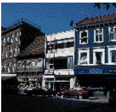
Bygningen er dårligt tilpasset nabobygningers arkitektur.

Meget dybe bygninger har desuden den ulempe at det er svært at skaffe tilstrækkeligt dagslys til alle rum.