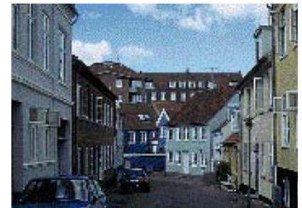
Her er det en selvfølge at vælge røde tegl som tagmateriale.

I Randers midtby er tagene karakteristiske ved at være 40°-50°-ers saddeltage, med rygning parallelt med gaden. Traditionelt er tagene