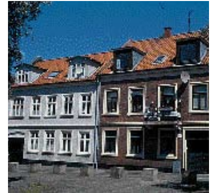
Proportionerne er vigtige for hvordan man oplever kvisten.

Tagformen skal tilpasses de eksisterende bygningers tagform. Tagmaterialet skal være velvalgt i forhold til husets arkitektur og gades karakter. Kra-