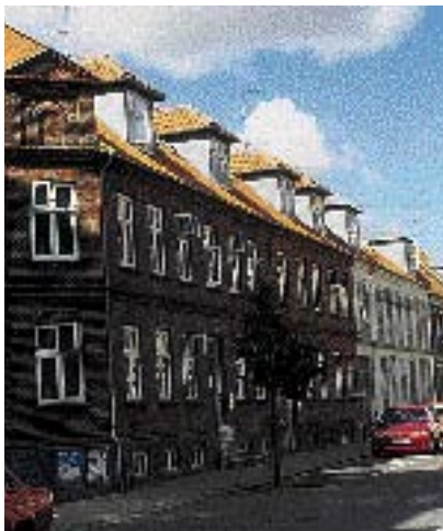
Bygningen fornemmes næsten en etage højere pga. kvistene.

Jo dybere bygningen er, jo større bliver tagfladen, og dermed bliver den let dominerende i forhold til gadens øvrige tage.