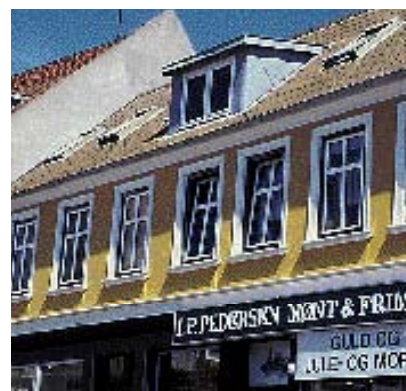
Når vinduet åbner indad er der kun et hul i muren tilbage.

Vinduernes placering og format har betydning for hvordan facaden opleves.