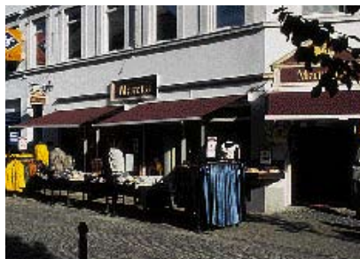
Den lange markise er opdelt i forhold til facadens inddeling.

stueetagen i handlegaderne, skal facadebredden begrænses til et indgangsparti. Et indgangsparti er en dør i passende bredde og et mindre udstillingsvindue (Se eksemplerne på denne side).