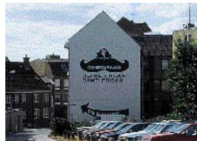
Oplevelsen af rummet mellem husene overdøves af reklamen.

Når en eller flere bygninger i en randbebyggelse/karré rives ned