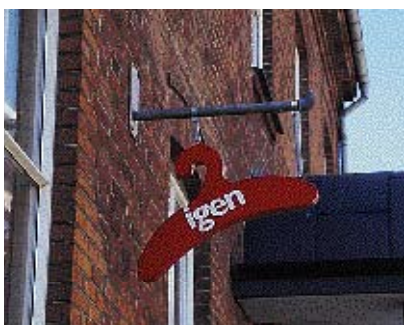
Der er mange muligheder når man udformer sit udhængsskilt. Fælles for de gode skilte er en umiddelbar aflæselighed af tekst, symbol eller logo.

terne ind på at højne kvaliteten. Den gode skiltning dominerer ikke bygningen, men underordner sig dens udformning. Særligt hvis en bygning huser flere virksomheder, bør skiltningen ses i sammenhæng, så facaden forbliver en helhed. For at opnå et harmonisk gadebillede er det en god idé at skele til gadens øvrige skiltning. Der kunne være en "linie" man kunne føre videre. Mærkevareskilte skal følge samme regler som anden skiltning.