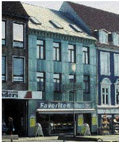
Facadebeklædningen reflekterer lyset så den ser plasticagtig ud

struktioner og fandt i stedet komplicerede løsninger. Det har ofte resulteret i, at resten af bygningen ser ud til at svæve oven på glasset.