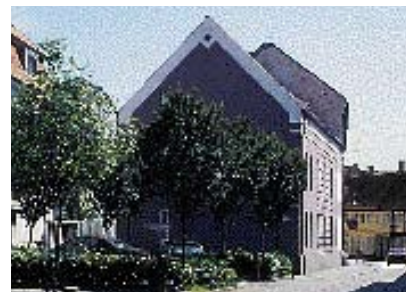
Samme farve på gavle og facader gør huset til en helhed.