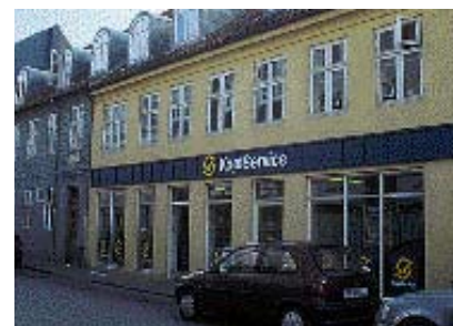
Det gennemgående skiltebånd skærer facaden over.

Anmassende store skilte hører 70'ernes bilisme til. Kundernes opmærksomhed skulle fanges, når de med høj hastighed kørte forbi. I dag er de potentielle kunder i bykernen fodgængere. Fodgængernes lave hastighed giver mulighed for at begrænse skiltningen - og i stedet sætte kræf-