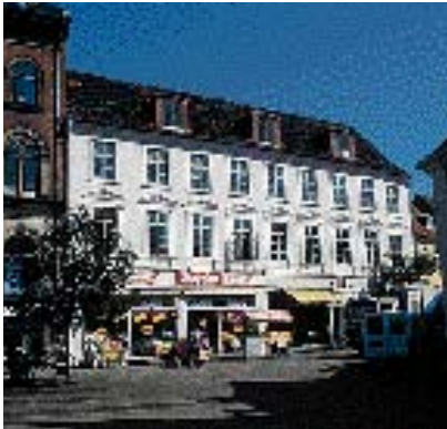
Kvistens materialer og farver bør afstemmes med facadens i øvrigt.

fritlægges gavlene, eller dele deraf, på de tilstødende bygninger. Nedrivning kan ske på grund af et gadegennembrud, et ønske om større friarealer, eller fordi man vil bygge nyt. En fritliggende gavl virker ofte voldsom, fordi proportionerne er store og detaljering mangler. Problemet løses ikke ved