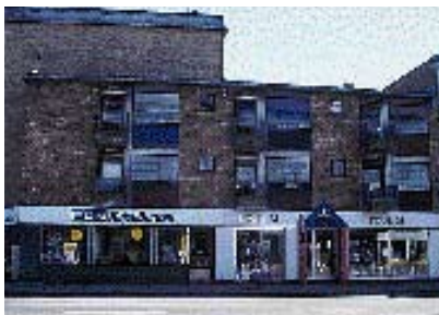
Bygningen er skåret over af facadebeklædningen.

Når man udformer eller renoverer en facade, er det vigtigt at være tro mod bygningskonstruktionen. Tidligere behandlede man især butiksfacaderne, som om de konstruktivt ikke hang sammen med resten af bygningen. Ønsket om store glaspartier til udstilling var dominerende. Derfor ignorerede man bygningens oprindelige kon-