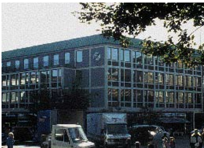
Bygningens arkitektur betyder meget for valget af tagmateriale.

fritlægges gavlene, eller dele deraf, på de tilstødende bygninger. Nedrivning kan ske på grund af et gadegennembrud, et ønske om større friarealer, eller fordi man vil bygge nyt. En fritliggende gavl virker ofte voldsom, fordi proportionerne er store og detaljering mangler. Problemet løses ikke ved