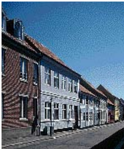
Bygninger med "samme" højde giver en rolig gade.