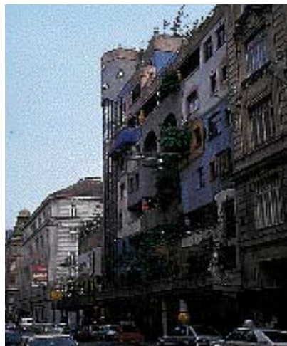
Noget ud over det sædvanlige, men bygget med sans for kvalitet.

de omkringboende eller trafikanter. Kravene til lysskilte er forskellige for midtbyens “kvarterer”, men