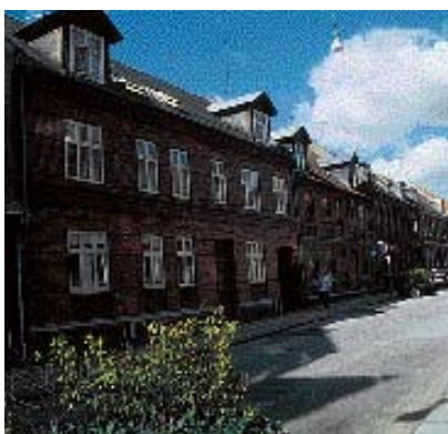
Lyse sprossvinduer og mørke vinduer - Forskellen er tydelig.

Kvistens materialer, proportioner og placering skal harmonere med