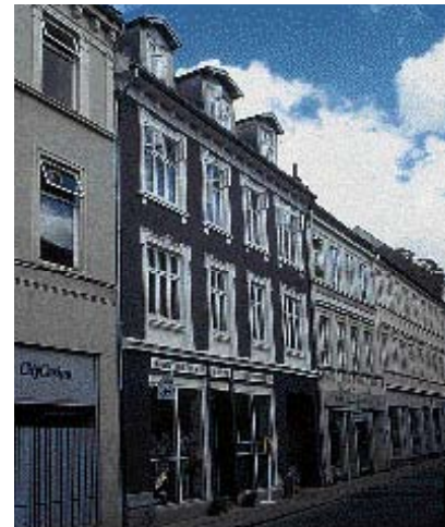
Originale materialer og facadebehandling brugt ved renovering.

I Randers midtby er de fleste facader enten af tegl eller pudsede og malede. På gamle bygninger vil