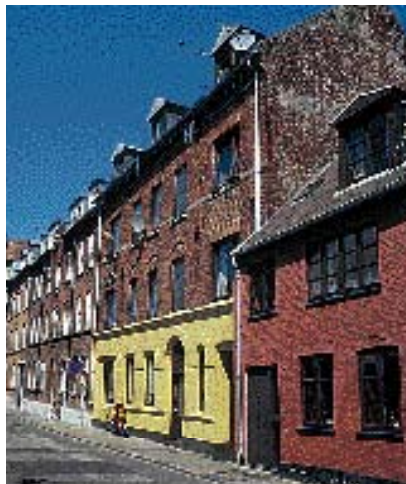
Antenneskoven på denne facade pynter ikke i gadebilledet.