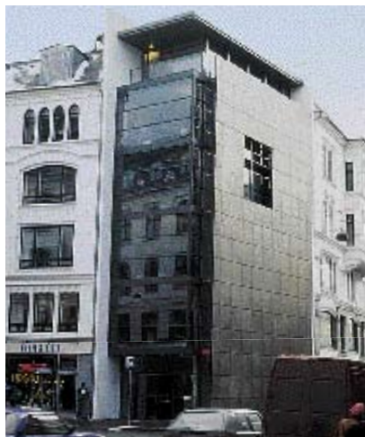
BT-bygningen er flot og moderne midt i det gamle København.

Lysmængden fra lysskilte skal begrænses og lyset må ikke blæn-