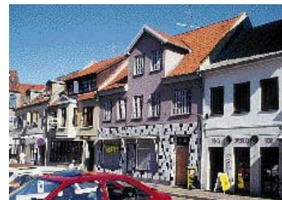
Facadebeklædningen skærer bygningen over.