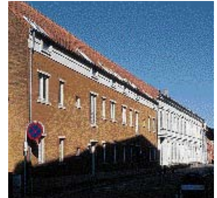
Den nye bygnings proportioner harmonerer med nabohusets.

facade kan være, hvis den ikke skal dominere gaden. Hvis facaden på en ny bygning er meget lang bør man derfor visuelt dele den op med lodrette markeringer, - også i tagfladen.