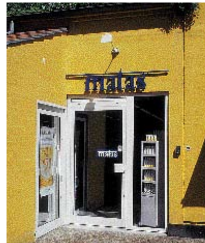
Eksempler på god facadeskiltning. De er fra henholdsvis Houmeden, Østergade og Gråbrødrestræde.

gaden skifter karakter, alt efter om butikkerne har åbent eller er lukkede. Som materiale til markiser egner ensfarvet lærred sig bedst. Det lever op til ønsket om kvalitet i bymidten, hvorimod plast og plastbehandlet lærred virker mere pauvert.