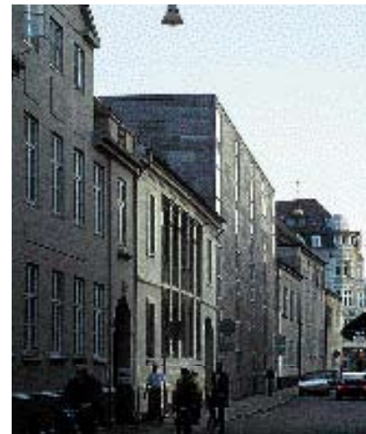
Højden er ikke afstemt efter den eksisterende bygningsrækkes.

tes at være. Når man forestiller sig en bygning afgrænses den opad til af taget. Tårne, kviste og skorstenene kan dog ofte få bygningen til at synes det meste af en etage højere.