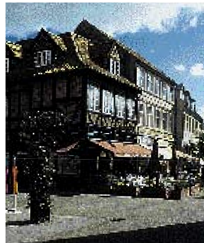
Eksempler på markiser som er tilpasset facaden. Eksemplerne er fra Østervold, Adelgade og Houmeden .