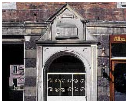
Gode detaljer som disse er med til at berige gadebilledet og give byens brugere oplevelser.