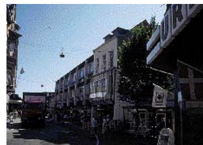
Spejlflekskerne fra glasset ødelægger facaden.