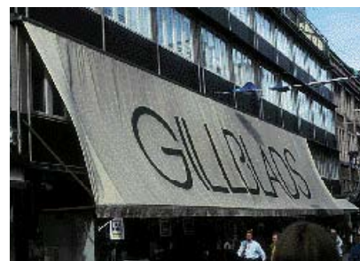
Markisen er placeret for højt og dækker 1. sals vinduer.

Tyverisikring skal respektere hele facadens udformning sådan, at forretningen stadig fremstår levende