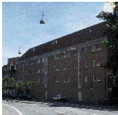
Den lodrette opdeling af facaden er ikke tilstrækkelig.

have øje for gadens "rytme". Med rytme menes længden af den enkelte facade i forhold til hele gedefacaden. Det betyder ikke at alle facader i en gade skal være lige lange. Der er dog grænser for hvor lang en