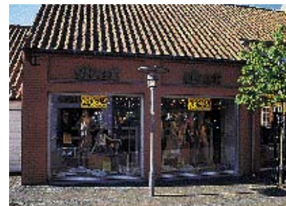
Bygningens opdeling respekteres af facadeskiltningen.