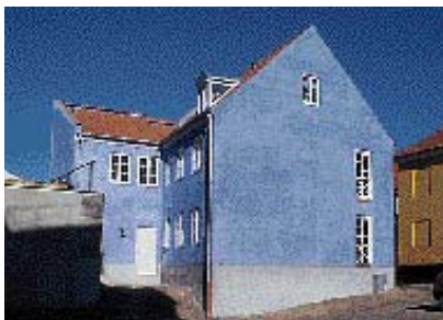
Gavlen er blevet åbnet med vinduer og dør ud mod torvet.

Selv om man ikke lægger sig fast på bestemte farveskalaer, er der alligevel nogle generelle tips, som er gode at skæve til, når man far-