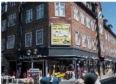
Skiltningen dominerer og er ude af proportion med bygningen

skiltning i hvert enkelt tilfælde. Tilladelse gives på betingelse af at skiltene tages ned ved butikkens ophør. Skiltningen skal begrænses og underordne sig bygningens arkitektur hvad angår størrelse, placering og farve. Flere virksomheders skiltning på samme facade skal samordnes. Begrænset skiltning med mærkevarer er tilladt på markisers forkant og vinduer, samt på øvrig skiltning, hvis butikkens og mærkets navn er det samme.