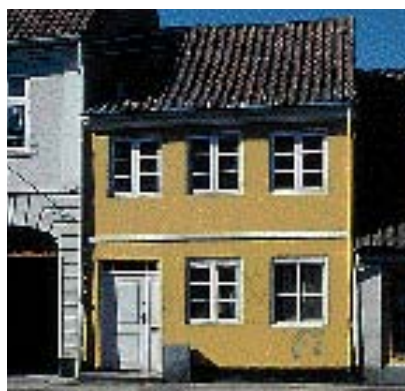
Sprosseopdelingen har betydning for hvordan facaden opfattes.

Nye vinduer og deres sprosseopdeling skal tilpasses bygningens stilart og arkitektur. Byrådet ser helst at karme og rammer er lyse