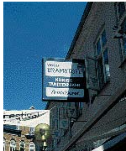
Jo større udhængsskiltet er jo flere detaljer dækker det på huset.

terne ind på at højne kvaliteten. Den gode skiltning dominerer ikke bygningen, men underordner sig dens udformning. Særligt hvis en bygning huser flere virksomheder, bør skiltningen ses i sammenhæng, så facaden forbliver en helhed. For at opnå et harmonisk gadebillede er det en god idé at skele til gadens øvrige skiltning. Der kunne være en "linie" man kunne føre videre. Mærkevareskilte skal følge samme regler som anden skiltning.