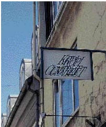
Selv på kort afstand er det svært at læse skiltet.