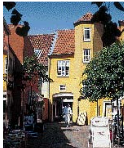
Porten er starten på strædet.

og at vinduerne åbner udad, med mindre bygningens arkitektur taler for noget andet. Krav-ene er dog forskellige for midtbyens "kvarterer" (Se lokalplan 262).