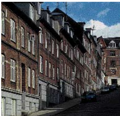
Fredensgade viser klart, hvad der menes med gadens rytme.

Når man "fylder" huller i facaderækken med nye bygninger, bør man