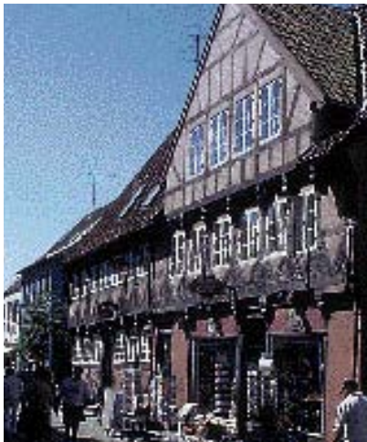
Renovering er sket med stor respekt for bygningens stil.

Når man udformer eller renoverer en facade, er det vigtigt at være tro mod bygningskonstruktionen. Tidligere behandlede man især butiksfacaderne, som om de konstruktivt ikke hang sammen med resten af bygningen. Ønsket om store glaspartier til udstilling var dominerende. Derfor ignorerede man bygningens oprindelige kon-