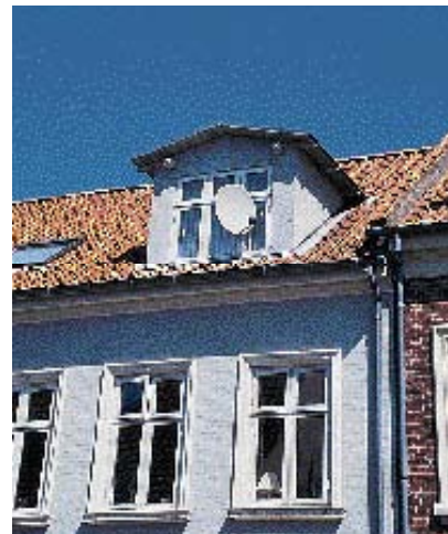
Parabolantennen dækker kvistens vinduesdetaljer.