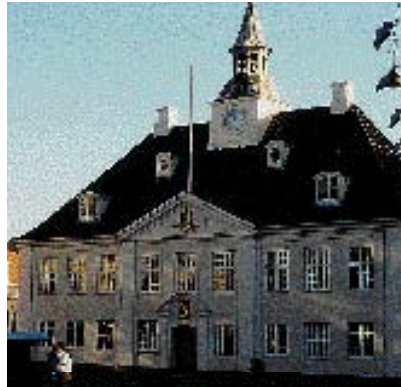
Kvistene er udformet som en del af facaden.

at dække gavlen med reklamer. Det vil fremhæve gavlen og gøre den mere anmassende. Når gavlen tiltrækker sig opmærksomheden, bliver det sværere at opleve helheden i det rum bygningerne danner mellem sig. Generelt er en diskret behandling af de fritstående gavle den bedste løsning.